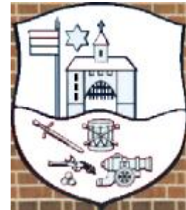
A cimer.bmp kép